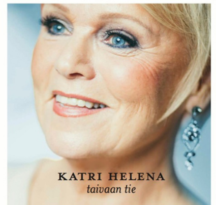
KATRI HELENA taivaan tie